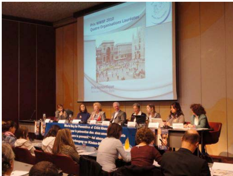
Table des intervenants lors de la conférence du 19 novembre 2010 au CICG – Genève

Thème : ‘Adultes et jeunes s’unissent pour une meilleure prévention des abus et de la violence envers les enfants et les jeunes’