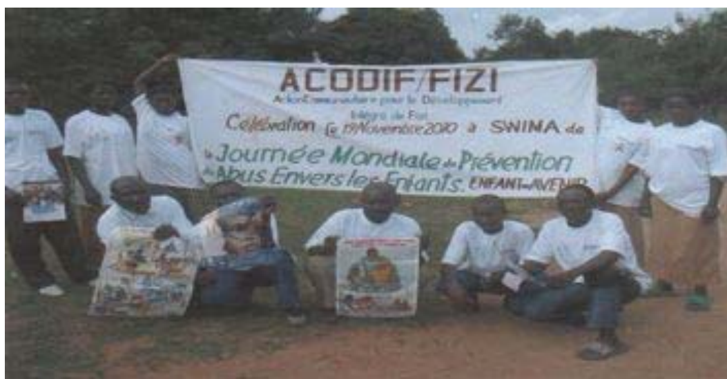
Celebrating the World Day for the prevention of abuse and violence against children and youth – 19 November 2010 – ACODIF/FIZI - RDC

Activities/events organized by WWSF and by coalition member organizations 473 organizations in 113 countries participated in the global campaign in 2010