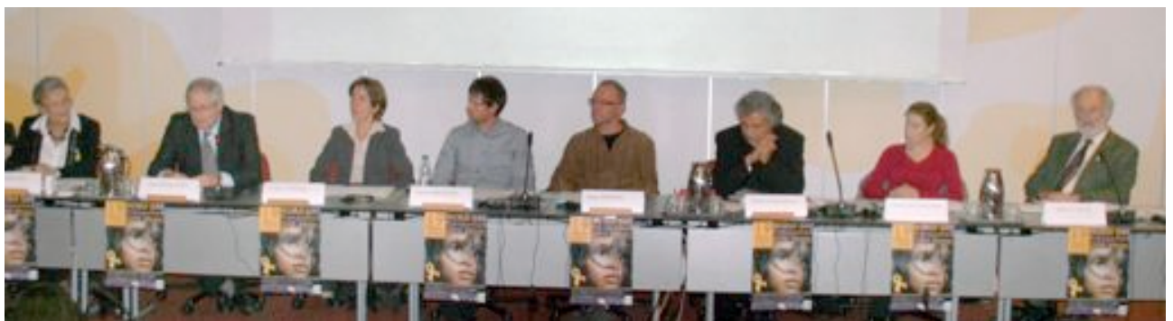
Table des intervenants lors de la conférence du 19 novembre 2009 au CICG - Genève

"Prévention des abus et de la violence : le rôle des parents, la réponse des adultes"