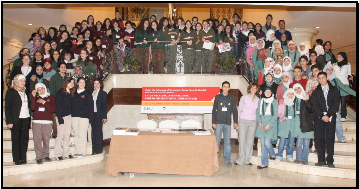
Celebrating the World Day for Prevention of Abuse and Violence Against Children-19 November 2009 and marking the Prevention Education Week 13-19 November 2009 at the Queen Rania Family and Child Center - QR FCC & Jordan River Foundation - JRF (Jordan)

Selected activities & events organized by WWSF international coalition members 787 organizations in 127 countries participated in the global 2009 campaign.